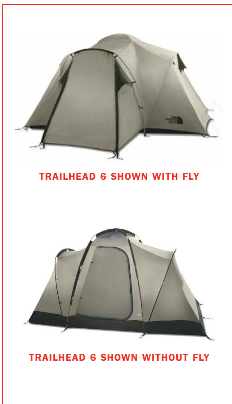
TRAILHEAD 6 SHOWN WITH FLY

The North Face Tent Pitching Instructions use pre-production samples for photography purposes. Material colors (including poles, webbing and fabrics) may change for production, but set-up method is accurate.