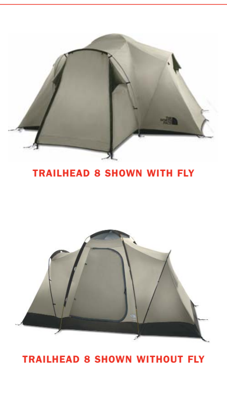
TRAILHEAD 8 SHOWN WITH FLY

The North Face Tent Pitching Instructions use pre-production samples for photography purposes. Material colors (including poles, webbing and fabrics) may change for production, but set-up method is accurate.