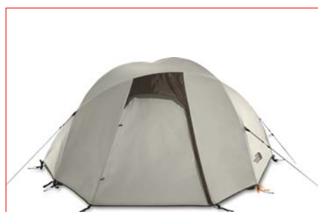
MORaine 33 SHOWN WITH FLY

The North Face Tent Pitching Instructions use pre-production samples for photography purposes. Material colors (including poles, webbing and fabrics) may change for production, but set-up method is accurate.