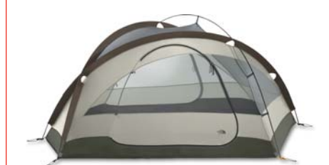
MORaine 33 SHOWN WITHOUT FLY