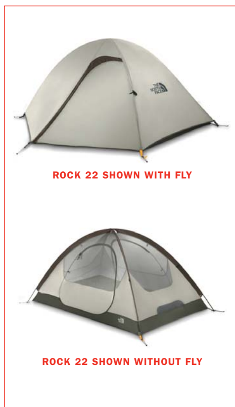
ROCK 22 SHOWN WITH FLY

The North Face Tent Pitching Instructions use pre-production samples for photography purposes. Material colors (including poles, webbing and fabrics) may change for production, but set-up method is accurate.