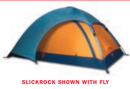
SLICKROCK SHOWN WITH FLY

seam grip | colle multiusage seam grip | nahtdichter One half-ounce tube of Seam Grip™ with brush